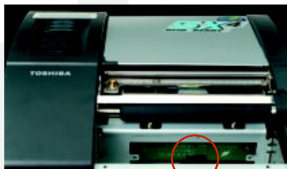
▲ UHF RFID Antenne